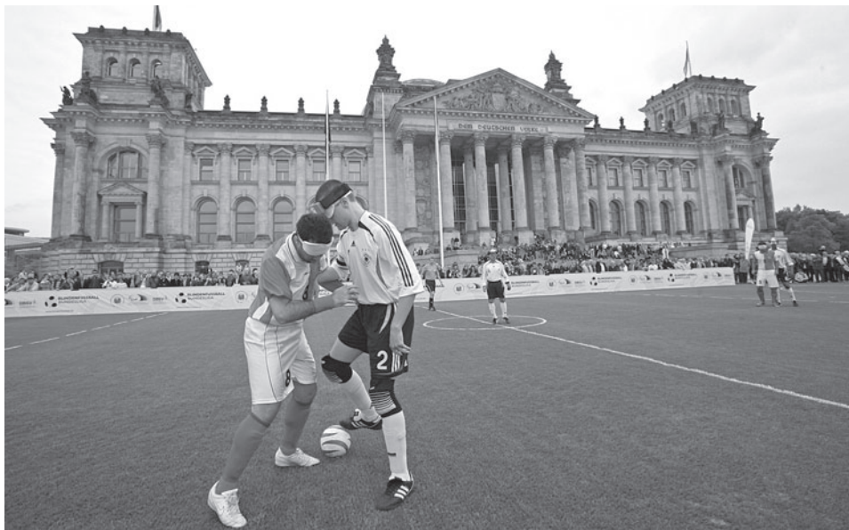
Mit Fußball in die Mitte der Gesellschaft - blinde Fußballer vor dem Berliner Reichstag.

Die DFB-Stiftung Sepp Herberger hat sich die Integration als 3. Säule ihrer Arbeit auf die Fahne geschrieben. Auch in Sachsen sollen schrittweise gemischte Fußballteams aufgebaut werden. Leider fällt die weitere Internetrecherche dazu unbefriedigend aus. In der Leipziger Sportförderungsrichtlinie wird ausgeführt: „Es können integrative Projekte für Menschen mit Behinderung, sozial Benachteiligte, Migrantinnen und Migranten sowie unterstützungsbedürftige Seniorinnen und Senioren gefördert werden.“ Ein gefördertes Projekt ist das vom Rehasportverein Leipzig e.V. „Sport nach einer Krebserkrankung – Familienorientierte ambulante Rehabilitation zur Wiedereingliederung junger Krebspatienten in den Schul- und Vereinssport“, welches in der Rehabilitation/im Behindertensport angesiedelt.